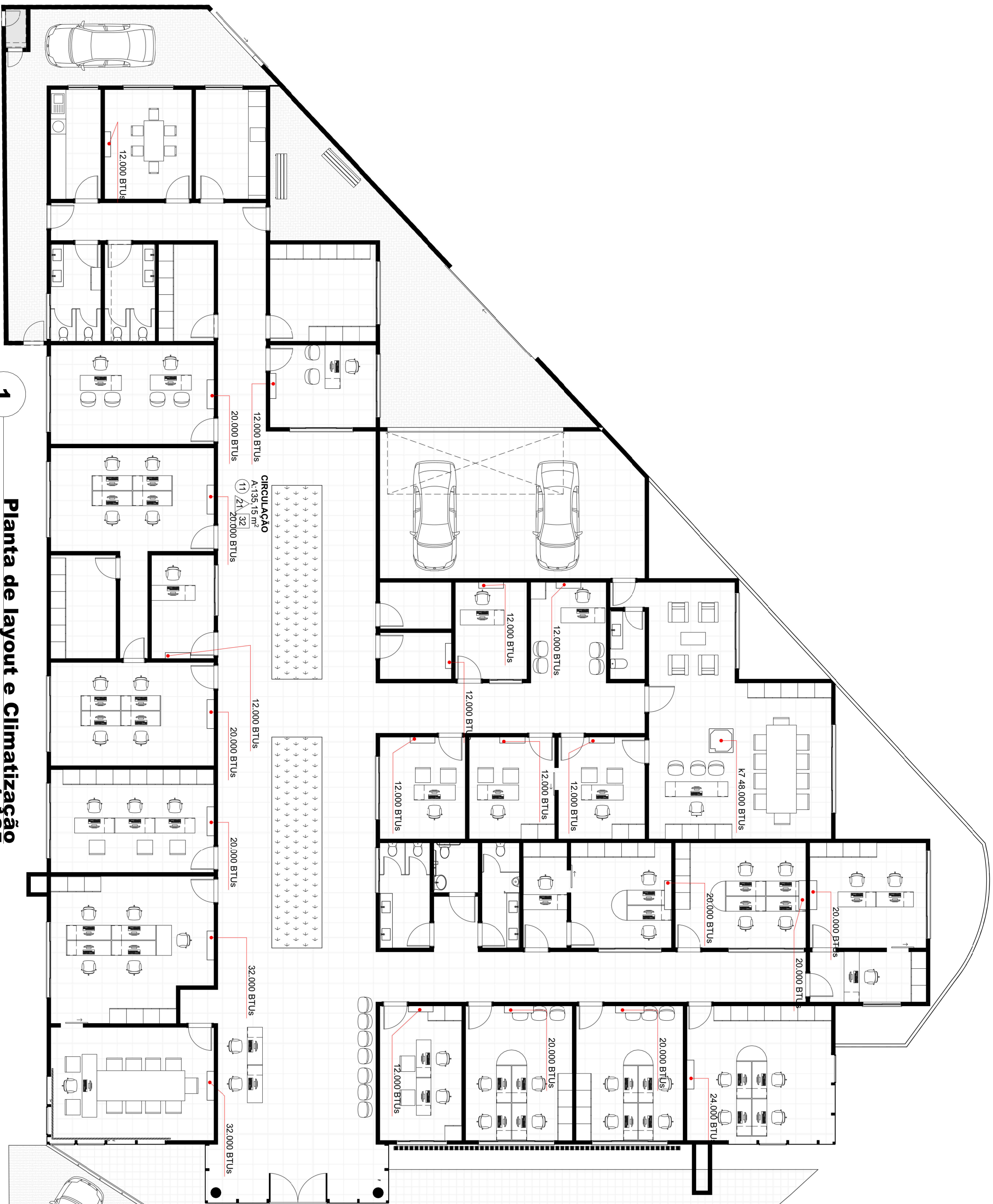
Planta de layout e Climatização 1:125