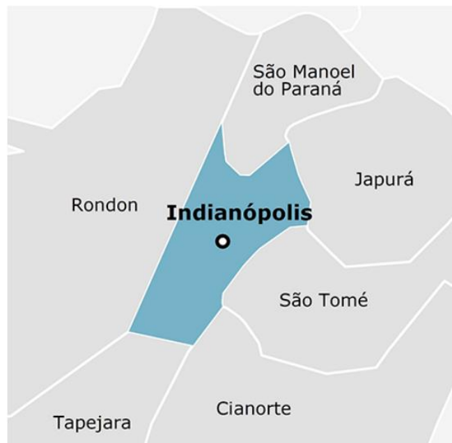
Figura 2: Municípios limítrofes de Indianópolis: Cianorte, São Tomé, Japurá, Tapejara, Rondon e São Manoel.