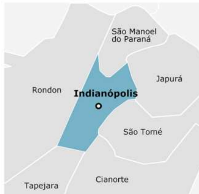
Figura 2: Municípios limítrofes de Indianópolis: Cianorte, São Tomé, Japurá, Tapejara, Rondon e São Manoel.