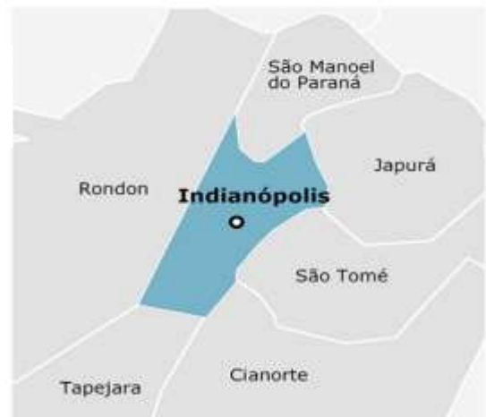
Figura 2: Municípios limítrofes de Indianópolis: Cianorte, São Tomé, Japurá, Tapejara, Rondon e São Manoel.